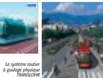
Le système routier à guidage physique TRANSLOHR